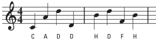
Abbildung 1.3: Noten verschiedener Tonhöhen im Liniensystem

Wir gehen also vertikal vor, und dazu wurde das Liniensystem (Abbildung 1.3) erfunden. Das Liniensystem ist jenes Raster aus fünf waagerechten, übereinanderstehenden Linien, in das Sie die Noten in Form kleiner Ovale eintragen können – und zwar sowohl auf als auch zwischen diesen Linien (deshalb spricht man von Liniennoten und Zwischenraumnoten ).