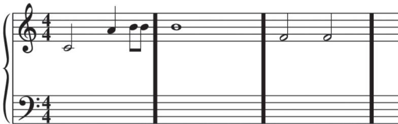
Abbildung 1.9: Notenzeile mit Taktstrichen

Dass ein Lied oder jede andere Art von Komposition nicht einfach eine endlose Aneinanderreihung von Tönen ist, dürfte klar sein. Wie jedes sinnvolle Gefüge lässt sich es sich natürlich gliedern. Wenn Sie sich eine Notenzeile ansehen, so wird Ihnen auffallen, dass sich in mehr oder minder regelmäßigen Abständen kleine senkrechte Striche auf den Linien finden, die jeweils so etwas wie einen musikalischen Sinnabschnitt kennzeichnen. Das sind die sogenannten Taktstriche (Abbildung 1.9). Zwei solcher Striche schließen jeweils einen Takt ein.