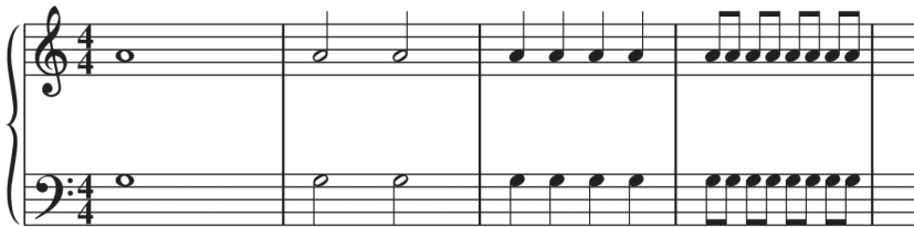
Abbildung 1.11: Verschiedene Notenwerte, von links nach rechts: ganze Note, halbe Note, Viertelnote, Achtelnote

Noten, das haben wir bereits festgestellt, werden auf dem Blatt als kleine Ovale dargestellt. Wenn Sie sich aber die Notation zu einem Musikstück ansehen, werden Sie feststellen, dass nicht alle Noten gleich aussehen. Das liegt daran, dass sie verschiedene Notenwerte haben – und der sagt nichts darüber aus, wie lieb und wert uns eine bestimmte Note ist, sondern kennzeichnet ihre Länge (Abbildung 1.11). Am häufigsten treffen wir beim Lesen von Notenblättern auf folgende Notenwerte: